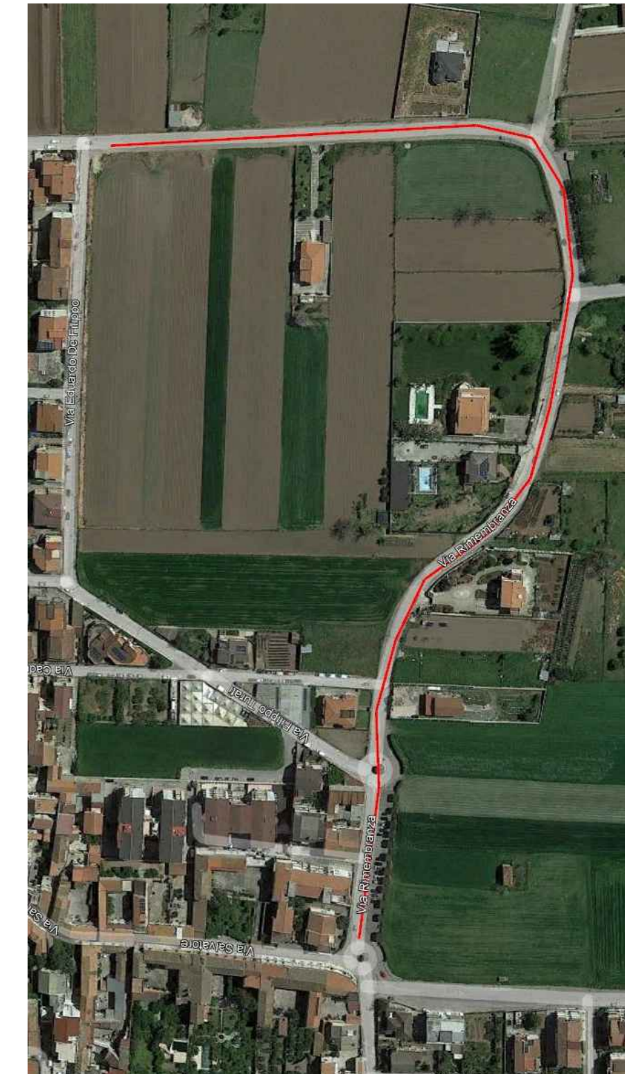
VIA RIMEMBRANZA Lunghezza - ML 470,00 Larghezza media - ml 6,00