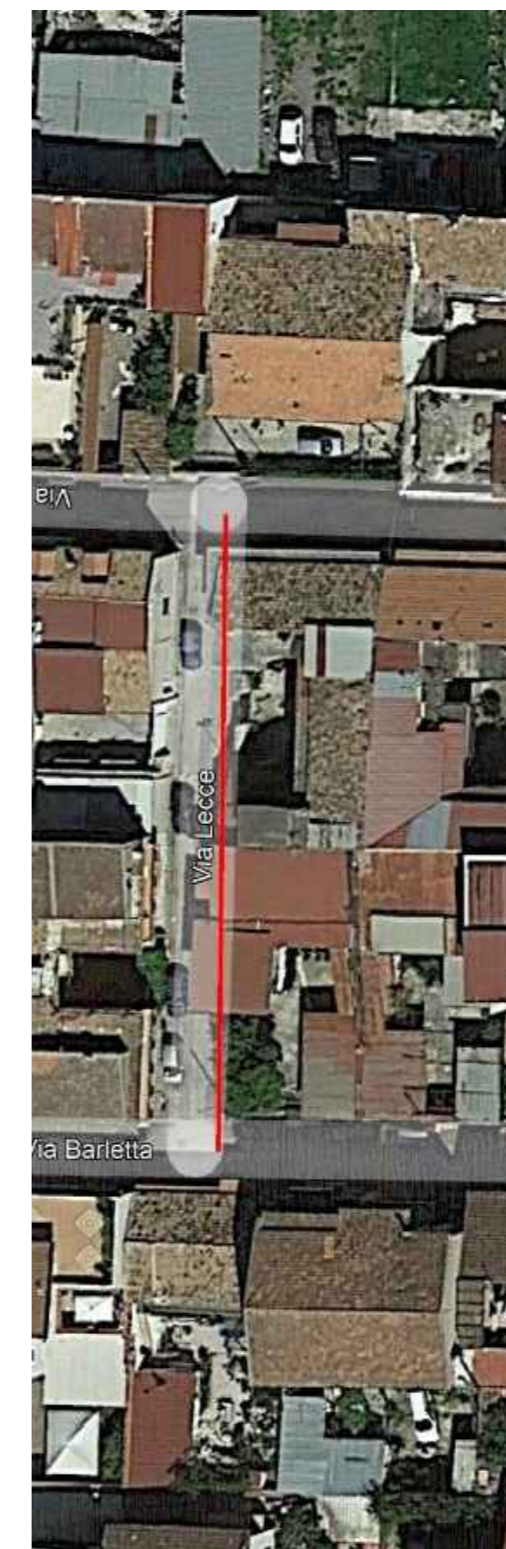
VIA LECCE Lunghezza - ML 50,00 Larghezza media - ml 5,00