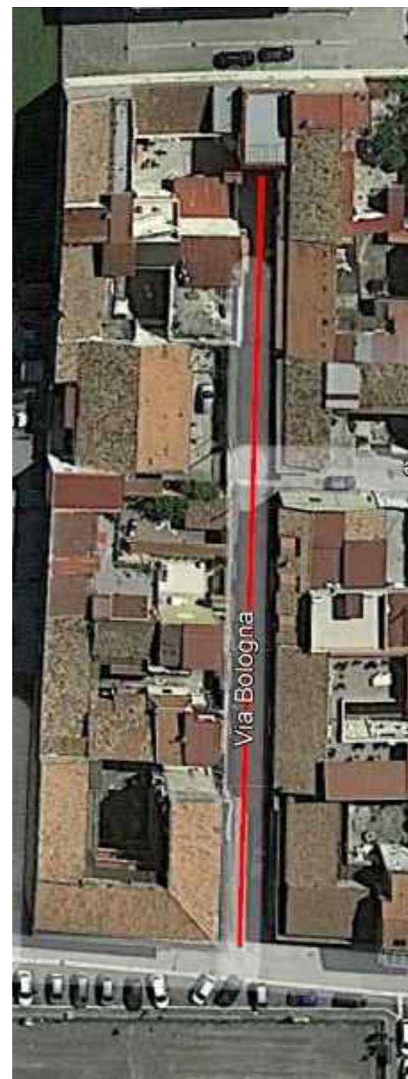
VIA BOLOGNA Lunghezza - ML 100,00 Larghezza media - ml 5,00